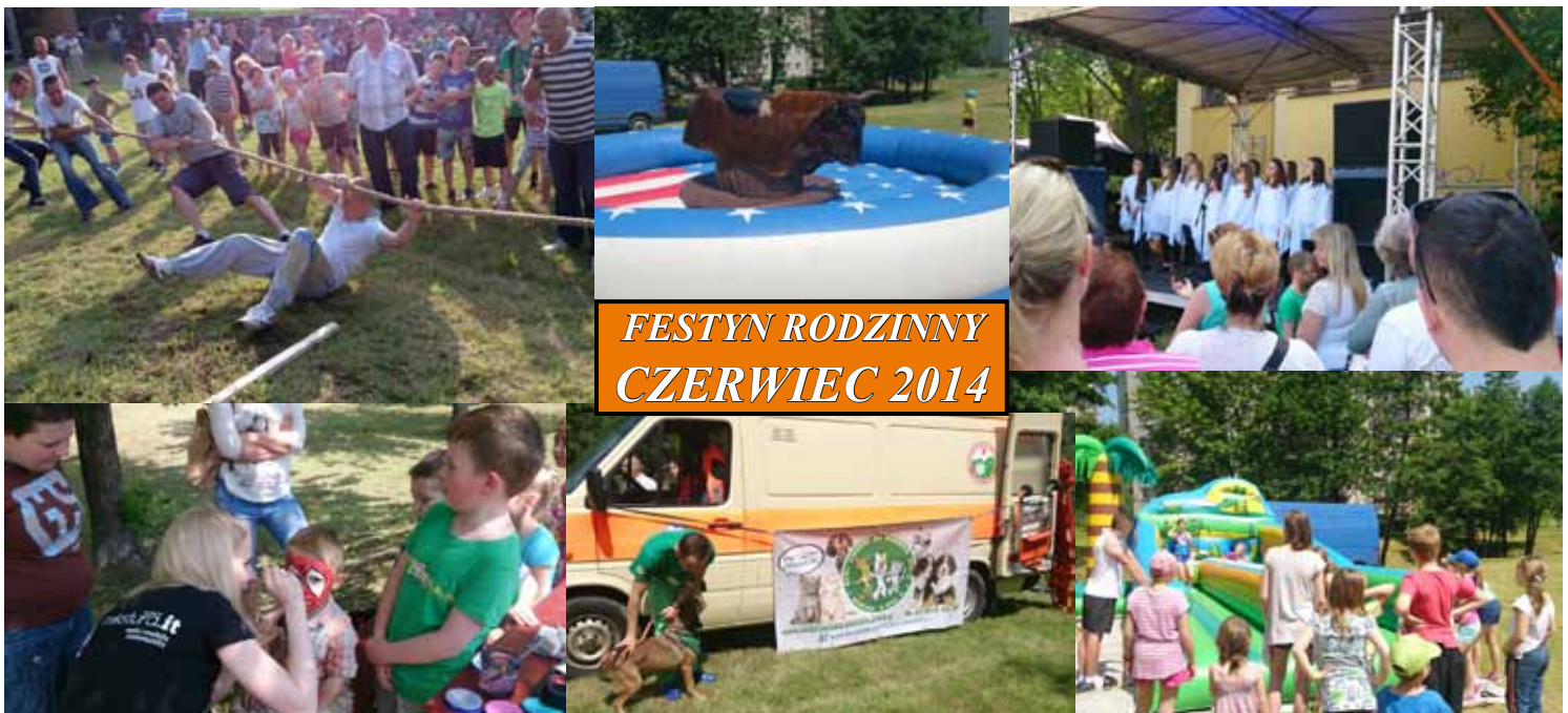
FESTYN RODZINNY CZERWIEC 2014